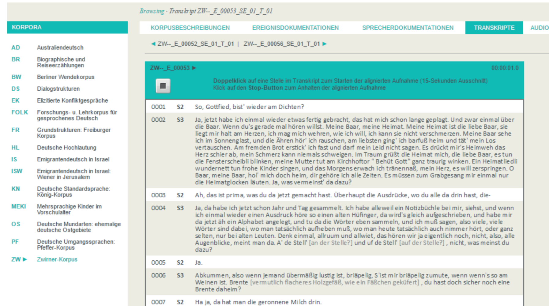
Abbildung 1: Anzeige eines Transkripts aus dem Zwirner-Korpus in der DGD

(GAT) für Minimaltranskripte in literarischer Umschrift mit dem Editor FOLKER erstellt und in Abständen von ca. 3-5 Sekunden mit der zugehörigen Aufnahme aligniert. Zur eigentlichen Transkription kommen mit einer orthographischen Normalisierung sowie einer Lemmatisierung und einem POS-Tagging (STTS mit TreeTagger) drei weitere Annotationsebenen.